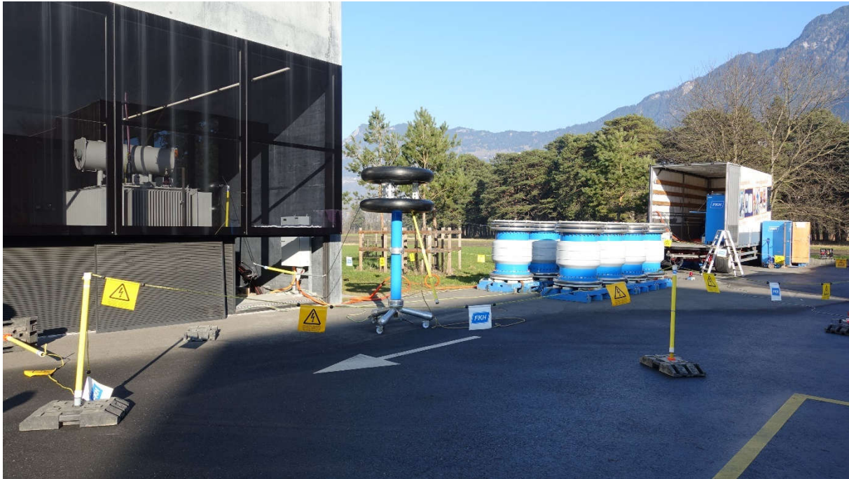
Abbildung 1: Absperrung der Prüfanlage mit Warnfahnen-Kordeln

Falls die Prüfanlage vom Bedienpersonal nicht einsehbar ist, muss genügend Überwachungspersonal eingesetzt werden. Ist dies nicht möglich, soll die Prüfanlage durch Zäune abgesperrt werden.